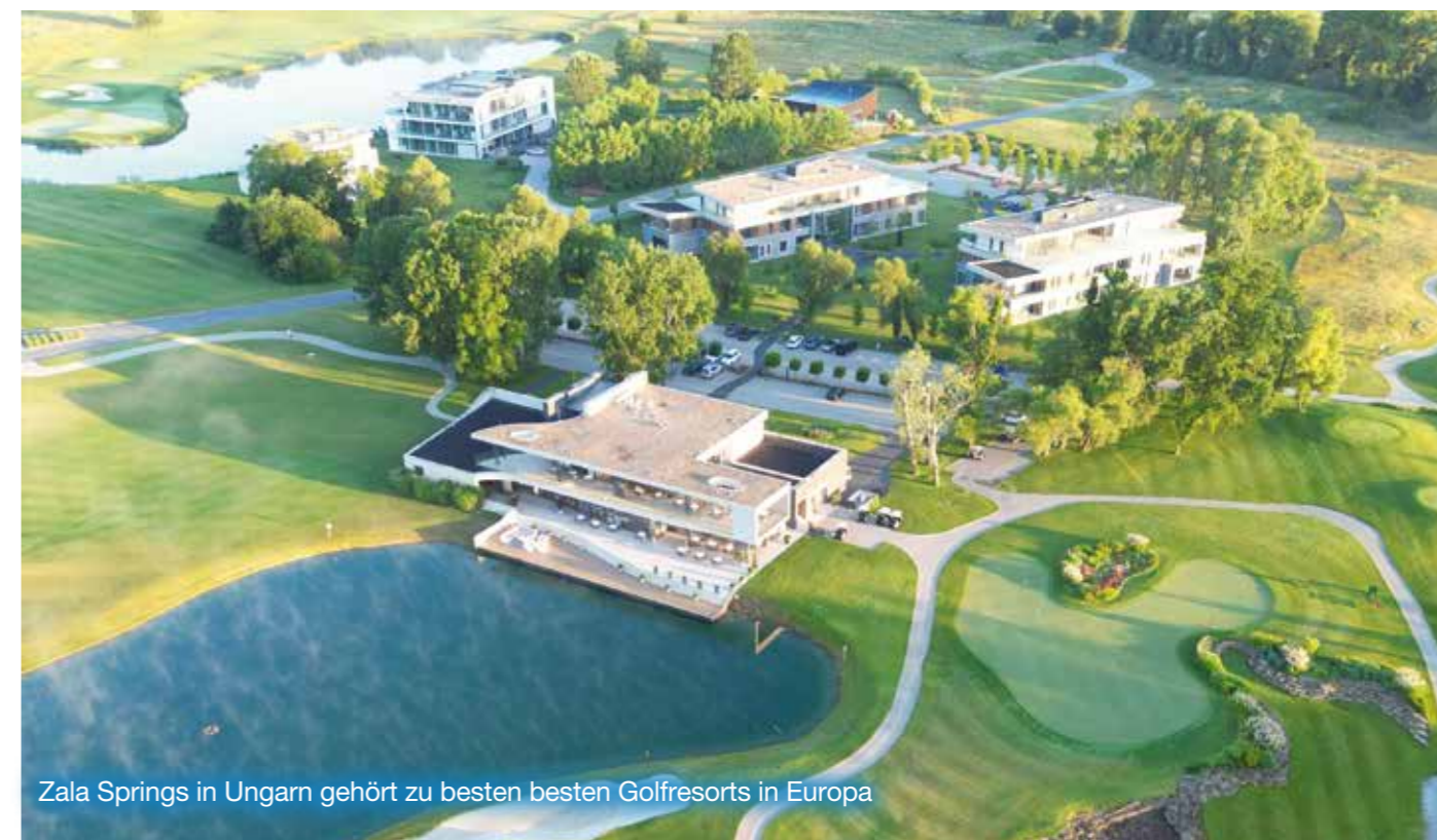
Zala Springs in Ungarn gehört zu besten besten Golfresorts in Europa