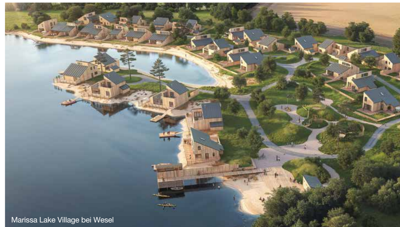
Marissa Lake Village bei Wesel